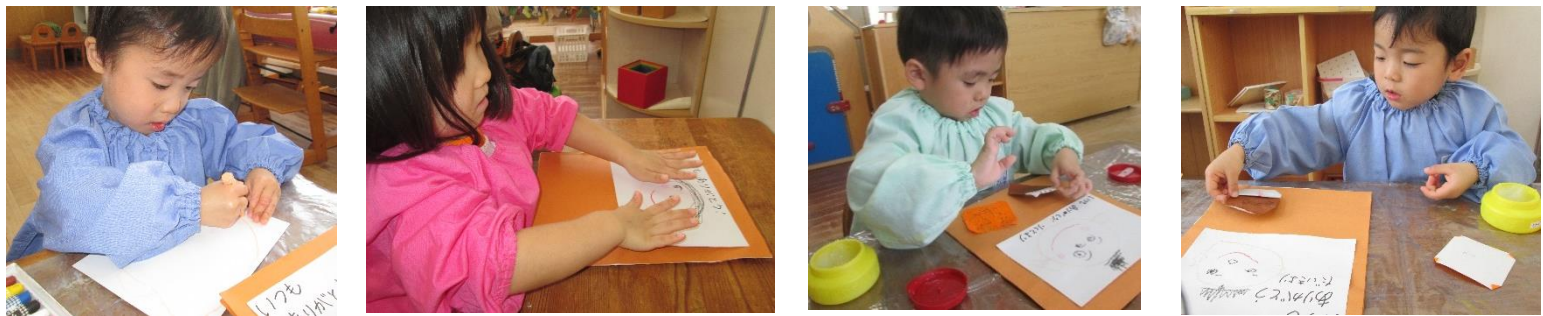
「お母さんたち喜んでくれるかね？」と、一生懸命に勤労感謝の日のプレゼントを作りました！