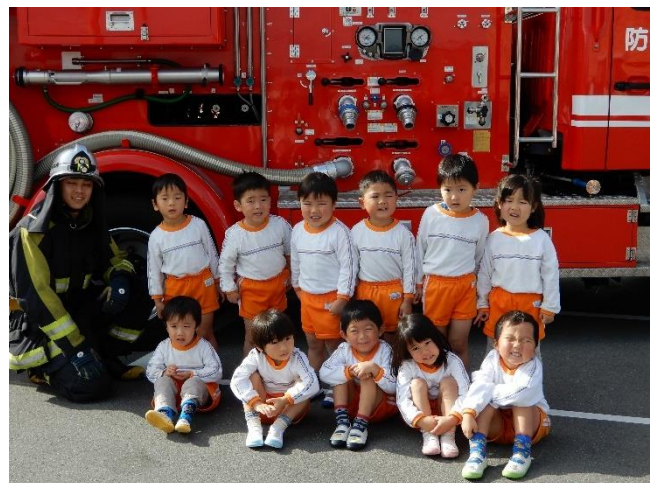
怖がりながらも避難訓練を頑張りました。大きくてカッコいい消防車に大交付な子どもたちでした！