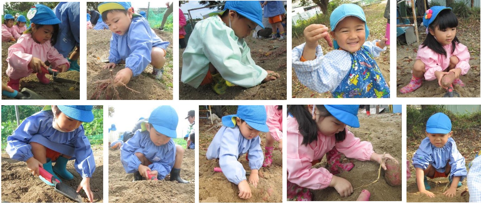
芋ほりに行きました！探すことに一生懸命な子どもたち☆大きなさつまいもにとっても喜んでいました。