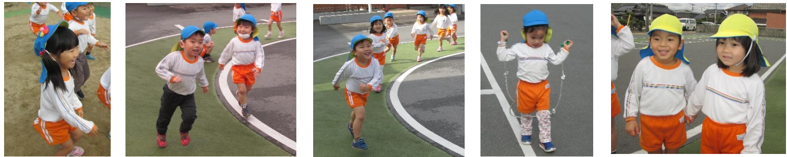
鬼ごっこをしたり、縄跳びの練習をしたりと元気いっぱいたくさん体を動かしました！！