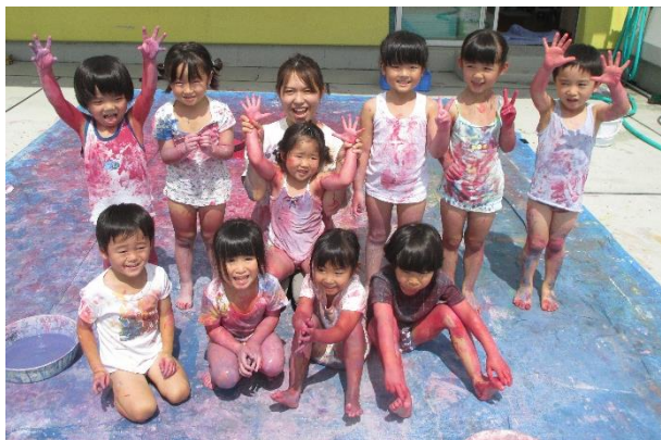
創造活動 ～ボディペインティング～