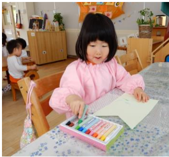
こいのぼり、誕生日カード、メダル製作をしました