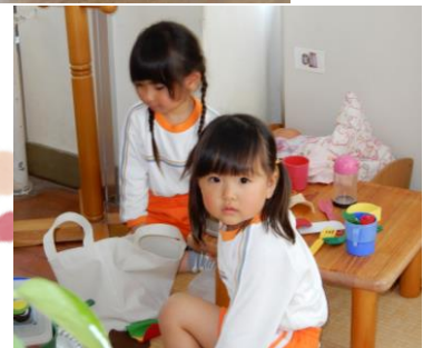
パンランチを食べたよ