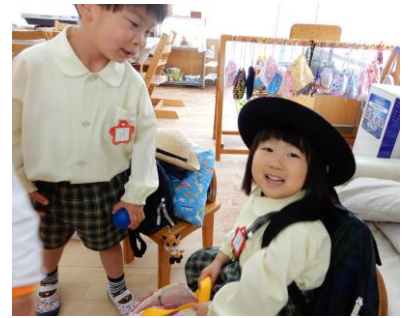
ママボールであそんだよ