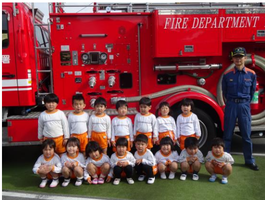
避難訓練(19日) 消防車をみんなで見ました!