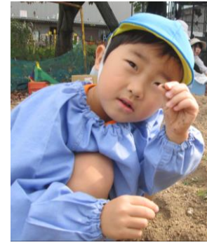
いもほり(7日) BS 物流さんで いもほりをしまし た! 楽しかったね!