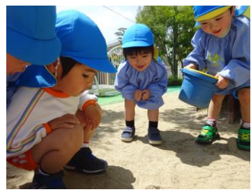
お友達とコーナー遊びや 戸外遊びをして、楽しんでいます！