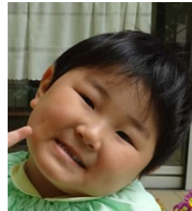
まつばら むげんくん