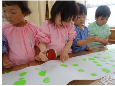
ママボールでふれあい遊びや スタンプ遊びをしました♪