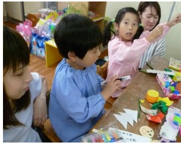
☆七夕製作☆保護者の皆様と協力して作ったね。みんなの願い事が叶いますように♪