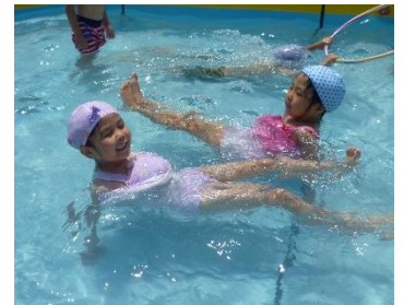
☆体育教室でプールあそび☆フープを使ってぐったり、顔をつけたりできたよ！できることがたくさん増えてきたね。