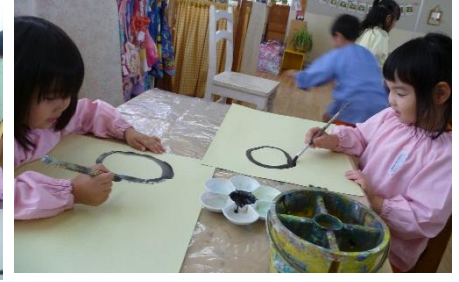
☆絵画制作☆鳥や牛、カニ、ヤドカリ、貝、たくさん描いたよ！