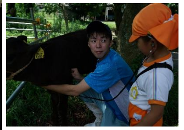
☆農業大学校見学☆牛の心臓の音を聞いて、餌をあげたね。胃が4つあるなんてびっくりしたね！かわいかったね。