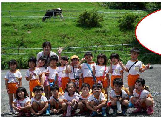
☆ほしぐみさん☆ はい♪チーズ♪