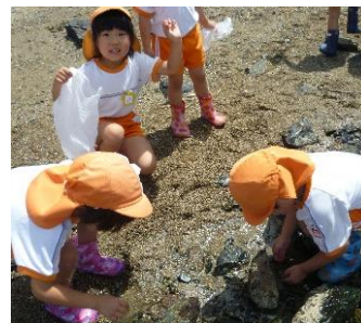
☆中浦の海見学☆カニやニナ、貝殻、海藻をたくさん見つけたよ！楽しかったね！