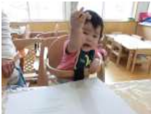
クレパスで、なぐりがきしてみたよ！