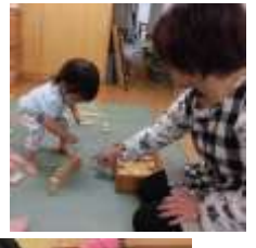
積み木で遊んだよ！