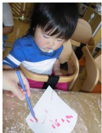
母の日のプレゼント作り！