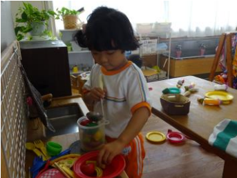
コーナー遊び 好きなコーナーを 選んで遊んでいます！