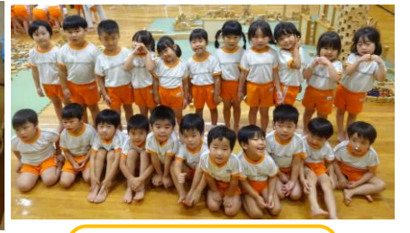
創造活動 積み木の前で、 はい、ポーズ♪