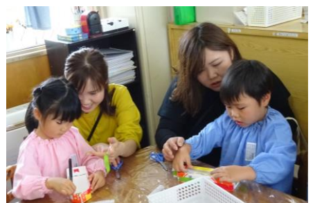
保護者会 お家の人と一緒に、牛乳パックの船を作りました♪ 楽しかったね！