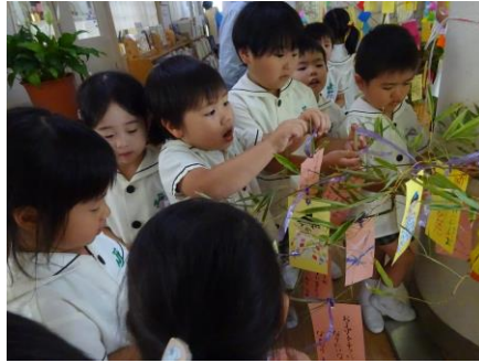
七夕製作 願いを込めた短冊を飾りました！ 輪飾りも一緒に飾りました♪